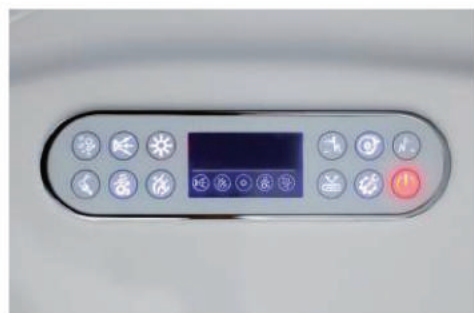
Pannello di controllo LCD Touch retroilluminato Touch backlit LCD control panel