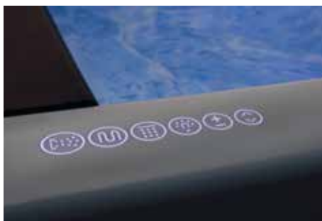
Pannello di controllo Touch retroilluminato Backlit touch control panel