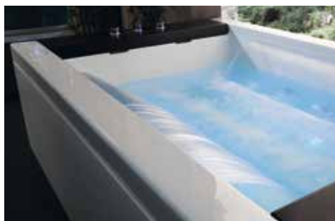
Idromassaggio con lama d'acqua Hydro-massage with waterfalls