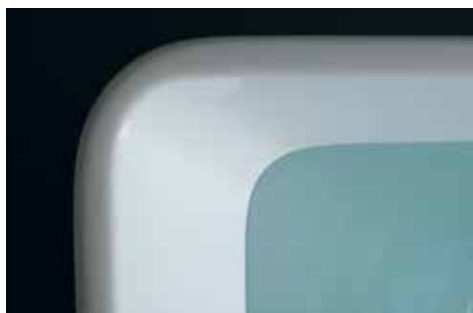
Bordo arrotondato Rounded edge