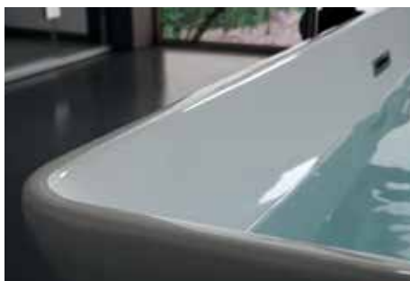
Finitura bianca lucida Glossy white finish