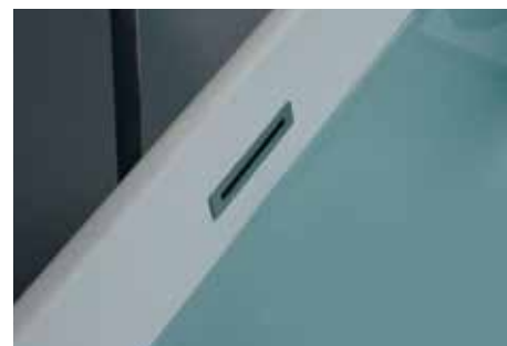
Trotopieno Overflow drain built-in