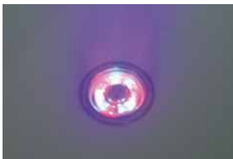
Getto Airpool con Cromoterapia Airpool jets with LED chromotherapy