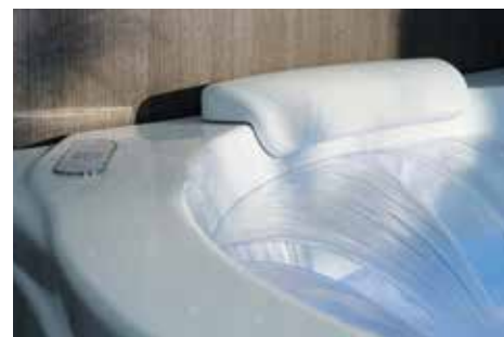
Cuscino ergonomico Ergonomic cushion