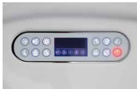
Pannello di controllo LCD Touch retroilluminato Touch backlit LCD control panel