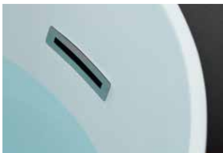
Troppopieno Overflow drain built-in