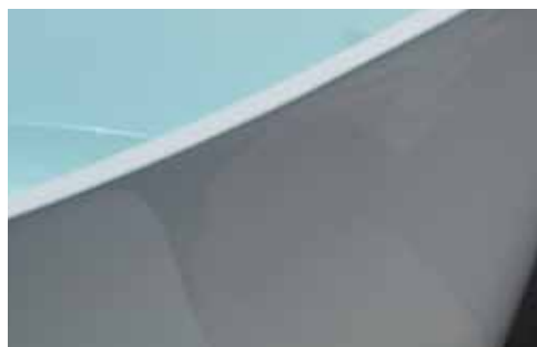
Finitura bianca lucida Glossy white finish