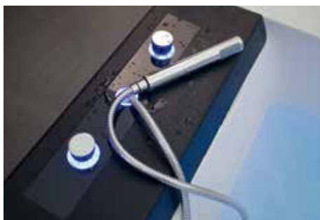
Rubinetteria a scomparsa con doccino estraibile Recessed taps and extractable hand shower