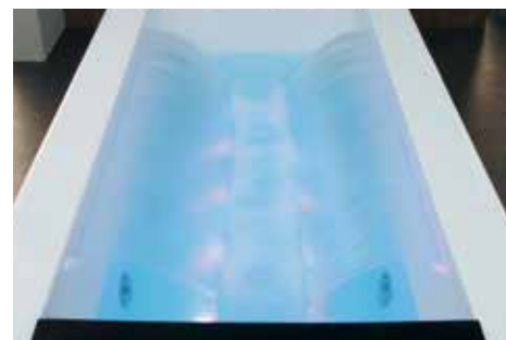
Doppia lama d'acqua Double waterfall blades